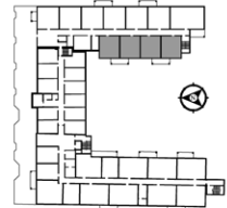
PLAN CLEF NIVEAU 2