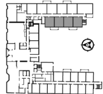
PLAN CLEF NIVEAU 1